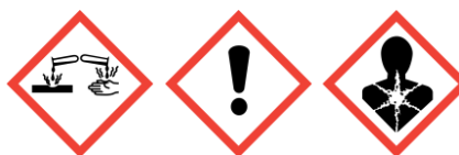
GHS05 GHS07 GHS08

Piktogramy określające rodzaj zagrożenia (CLP) :